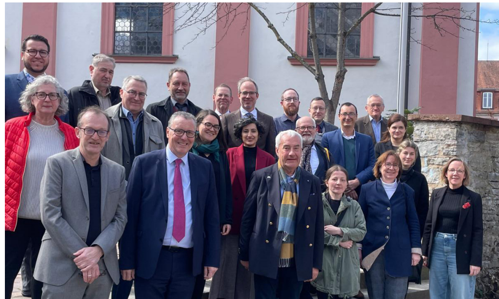
Arbeitsreffen Bayerisches Genisa-Projekt in Veitshöchheim