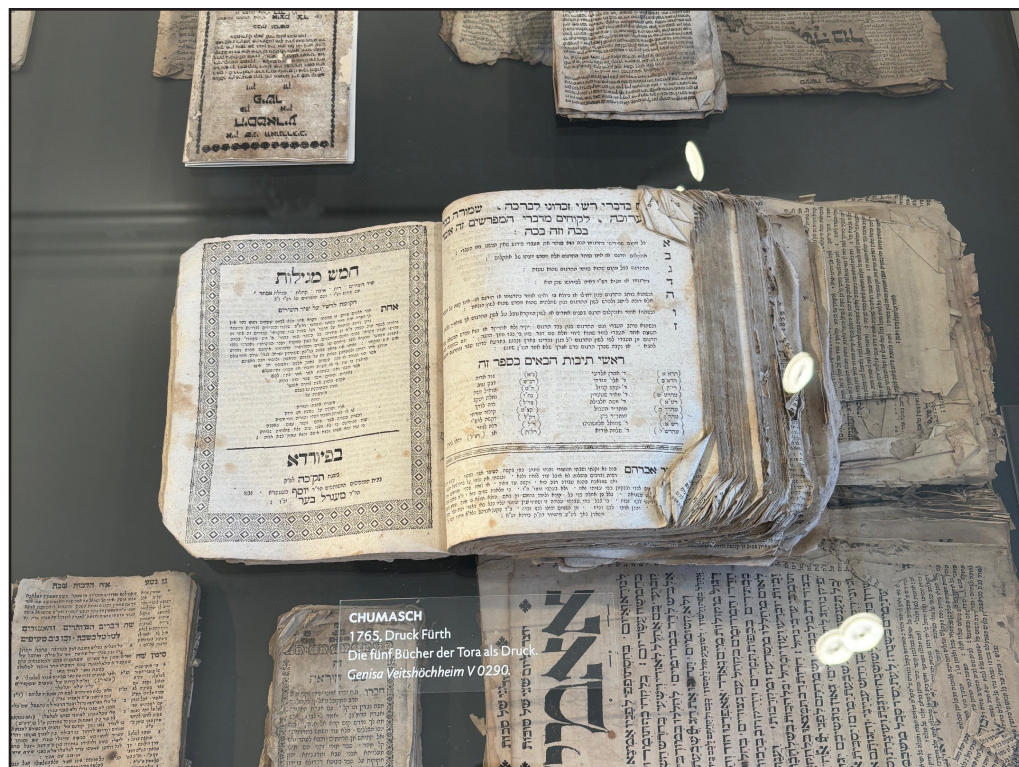
CHUMASCH 1765, Druck Fürth Die fünf Bücher der Tora als Druck Genisa Veitshöchheim V 0290

Was den Namen Gottes trägt, darf nicht zerstört werden