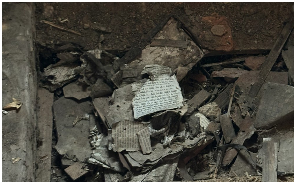
Genisa im Dachstuhl der ehemaligen Synagoge im unterfränkischen Aub