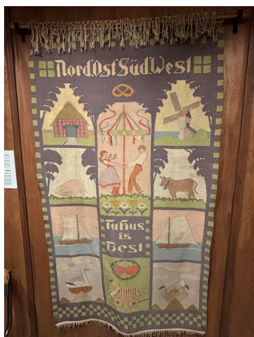
Wandbehang mit Stickereien, Jeckesmuseum Haifa, Israel

kulturpolitische Initiative zugunsten des Erhalts und der Vermittlung des deutschstämmigen Judentums und haben den Fraktionsvorsitzenden der demokratischen Parteien des Bundestags eine Resolution vorgeschlagen, die die Bedeutung dieses Erbes für Deutschland betont. jg