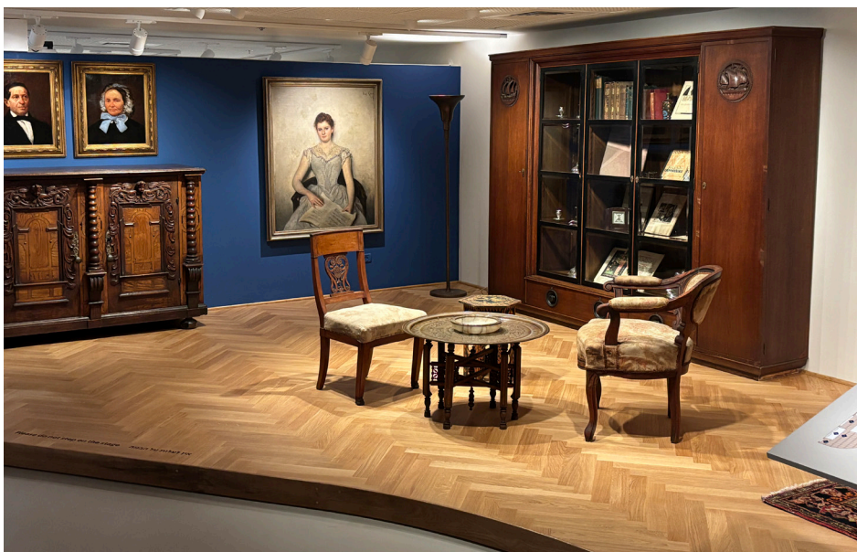
Ausstellungsraum im Jeckesmuseum in Haifa, Israel

Beauftragten ist es, die Geschichte, kulturelle Identität und das Erbe der deutschsprachigen Israelis sichtbar zu machen und in einen zeitgemäßen, wertschätzenden Dialog mit der deutschen Gesellschaft zu bringen. Um die Relevanz dieses Themas zu unterstreichen, engagieren sich die Kooperationspartner auch gemeinsam auf Bundesebene für eine neue