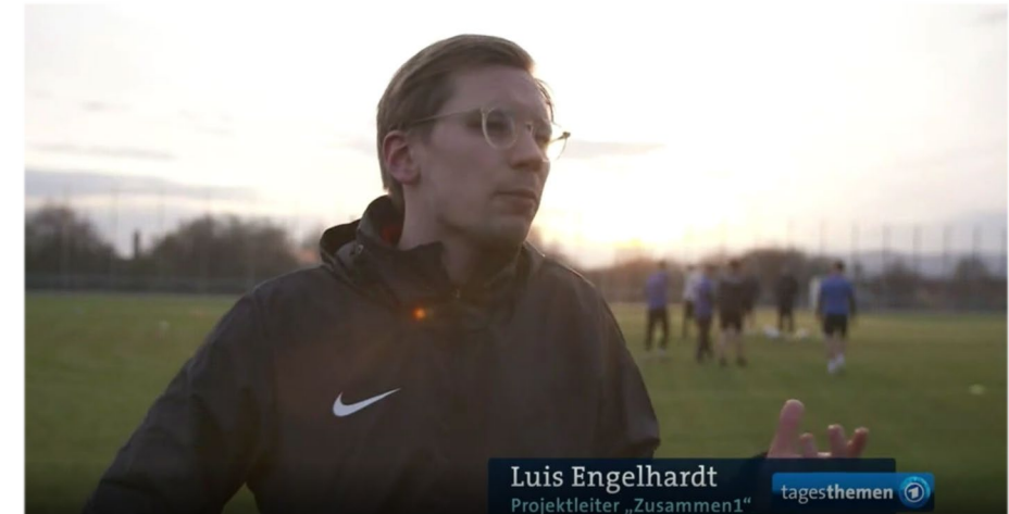
Vorstellung unserer pädagogischen Trainings in den ARD-Tagesthemen